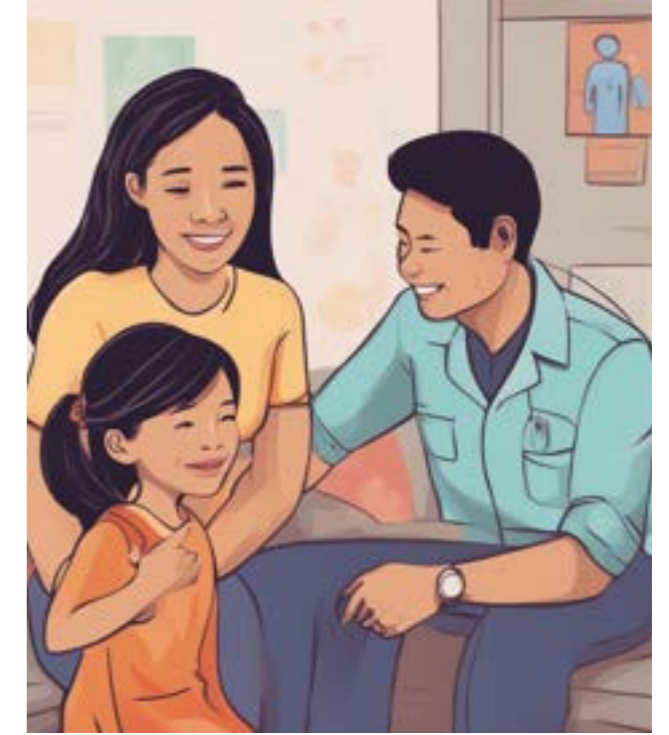
ជួយពីឪពុកម្តាយ

វិជ្ជុលអាចប្រាស្រ័យទាក់ទង និងឆ្លើយឆ្លងជាមួយអ្នកដទៃ ព្រមទាំងអាចរាប់អានមិត្តភក្តិនៅសាលាបានជាធម្មតា។ ដោយមានកិច្ចសហការ និងការគាំទ្រយ៉ាងជិតស្និទ្ធពីវិស័យអប់រំ និងសុខាភិបាល ព្រមទាំងឪពុកម្តាយផង ទើបធ្វើឲ្យនាងឈានដល់សក្តានុពលពេញរបស់នាង។