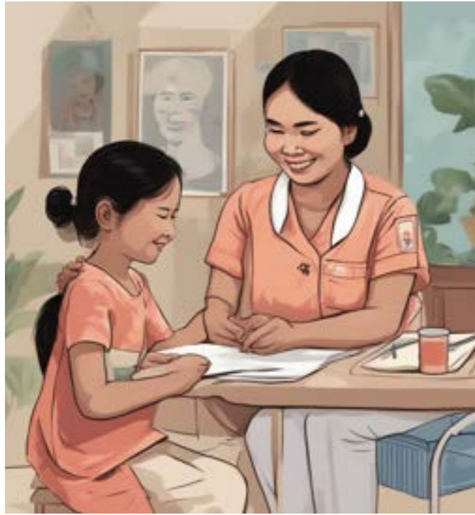
ជួយពីអ្នកព្យាបាល