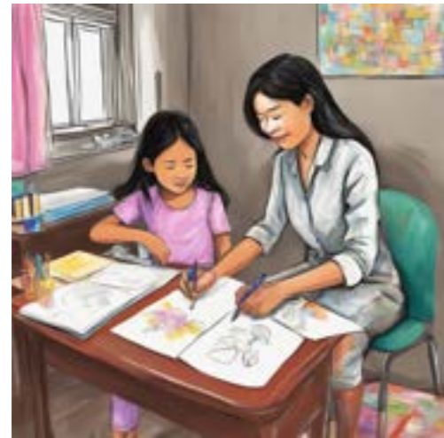
មណ្ឌលថែទាំសុខភាពផ្លូវចិត្ត