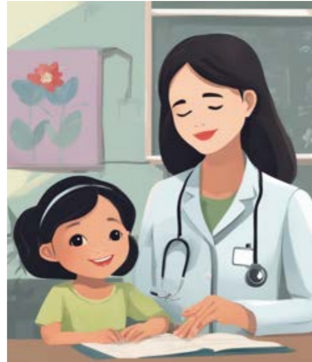
ជួយពីគ្រូពេទ្យ