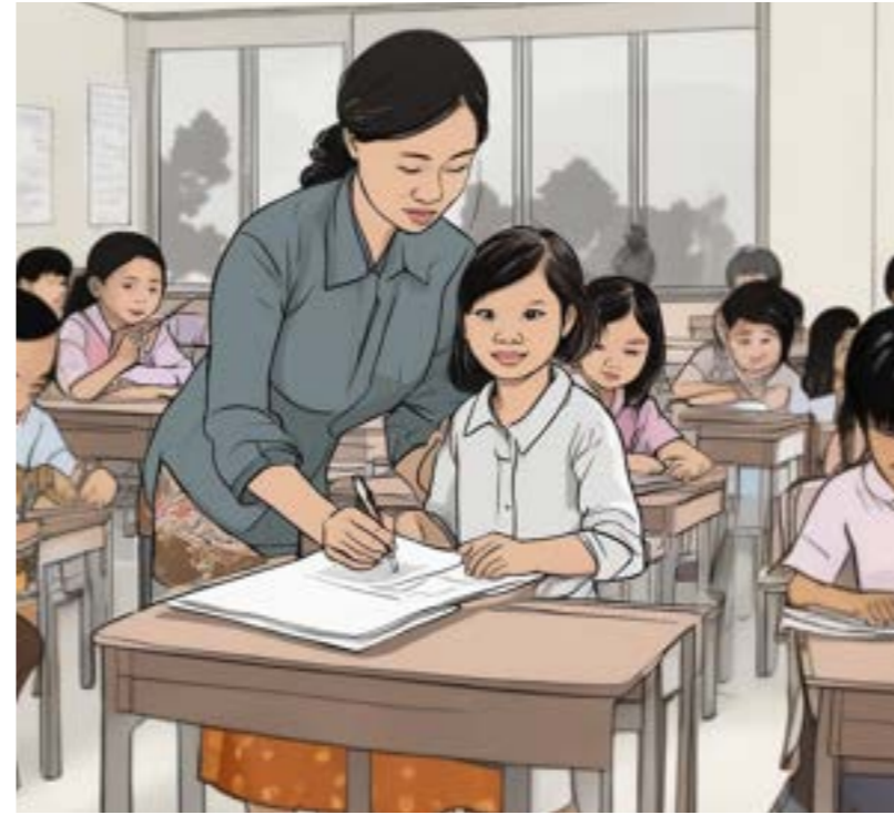
ជួយពីគ្រូបង្រៀន